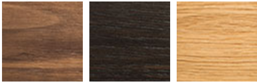
NC noce canaletto